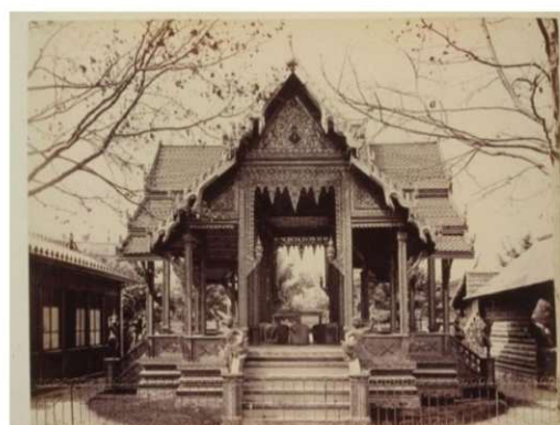
1889年のパリ万国博覧会におけるタイパビリオン (当時、シャム館)