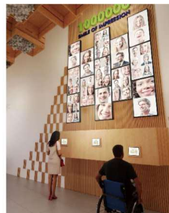
【エリア1,000,000】最後はタイスマイルで