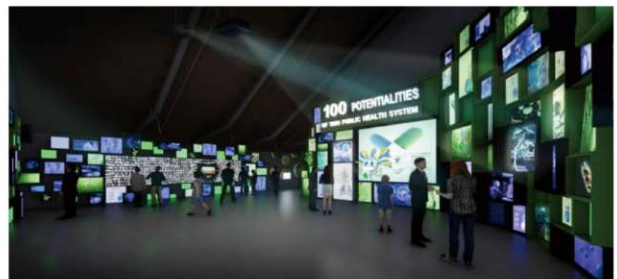
【エリア100】の光と映像の演出

強固な医療体制と国際協力を通じ、タイが世界的な医療ハブへと成長する姿を紹介し、光と映像が連動する演出により、100を超える展示が一体となり、 タイの公衆衛生の発展 と医療イノベーションの可能性を視覚的に体感できるエリアとなっている。