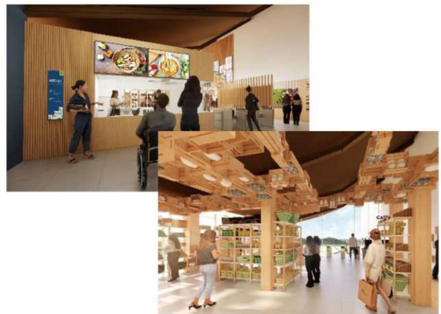
【エリア100,000】でお腹もいっぱい、手もいっぱい

また、期間限定展示スペースで、タイの伝統的な健康製品作りや、タイの健康製品、文化を体験できる体験型エリアが提供される。