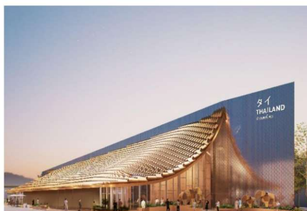
2025年大阪・関西のタイパビリオン

来場者は、五感を刺激する演出を通じて、「大きな幸福のため、いのちに力を与える」というテーマを深く理解し、タイの未来ビジョンに共感できる空間となっている。