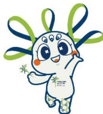
タイパビリオンの公式キャラクター「プーム・ジャイ」 「感動の笑顔」がコンセプト