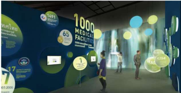
【エリア1,000】1,000の医療施設を紹介

さらに、AIによる糖尿病網膜症スクリーニング、3Dプリンティング技術による骨再生、高齢者ケアロボットなど、 最先端医療技術 を体験できるインタラクティブスペースも設置されている。