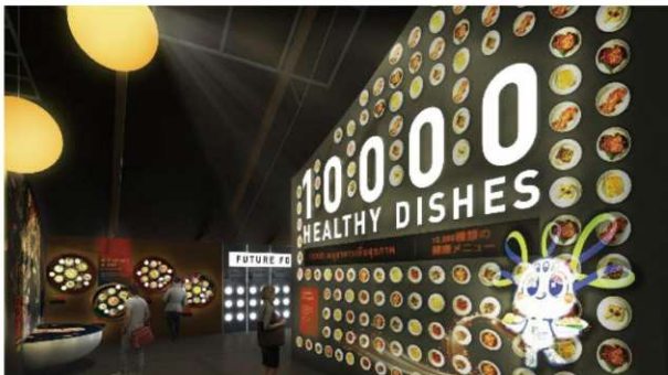
【エリア10,000】食通なら見逃せない

さらに、タッチスクリーンパネルを通じ、外国人が治療目的で訪れる15の主要疾患カテゴリーごとに、タイ国内の医療機関を紹介し、各施設の専門分野や先進的な治療技術に関する情報を、直感的に探索できるインタラクティブな展示を展開している。