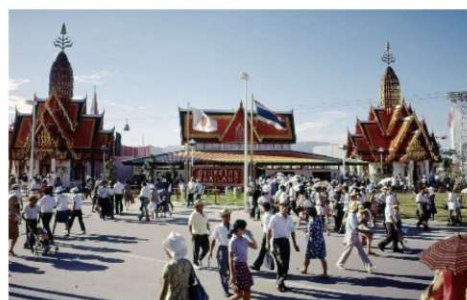
1970年の大阪万国博覧会におけるタイパビリオン

** タイパビリオンに関する最新情報： 公式ホームページ https://thailandpavilionworldexpo2025.com/ Instagram: thailandpavilionworldexpo2025 Facebook: Thailand Pavilion World Expo 2025 X (旧Twitter) : THpavilion2025