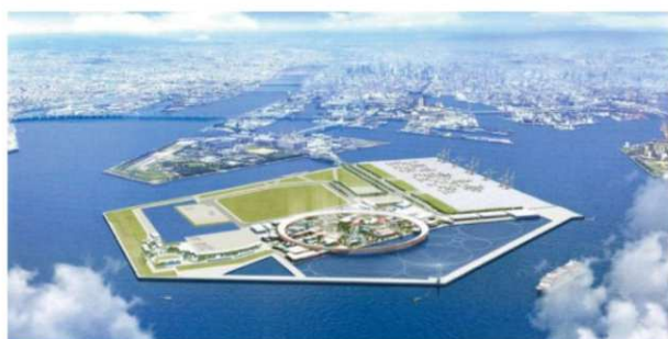
2025年大阪・関西万博会場

Thailand Pavilion -THAILAND Connecting Lives for Greatest Happiness- Key Words : Expo 2025, Medical hub, Wellness, Immunity