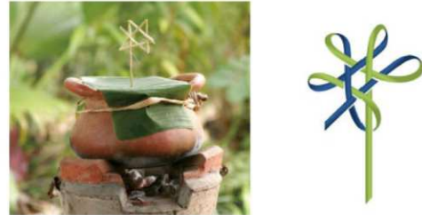
左：【チャレーウ】葉壺に挿して邪気を払う、竹細工のような神聖な護符。タイの伝統的な知恵と健康の象徴 右：タイ伝統医療の象徴である「チャレーウ」を用いたタイパビリオンのモチーフ

「Chalew (チャレーウ)」を仮想空間でタイ各地にピン留めすることができる。タイが誇るウェルネスとヘルスケアの魅力を世界に発信し、訪れる人々とともにタイ館への道を歩むインタラクティブな体験空間となっている。