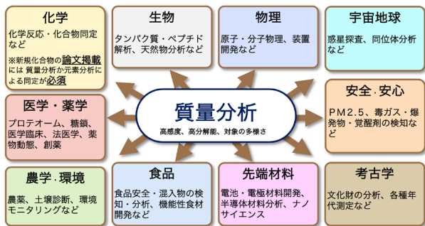
図1 質量分析の応用範囲

極めて高感度であり、ナノグラムからピコグラムレベルの試料量で分析が可能です。さらに、二段の質量分離部を組み合わせたタンデムマスマスペクトロメトリー(MS/MS)では、第一段で化合物固有のイオン(プリカーサーイオン)を選別し、不活性ガスとの衝突により分解・生成するイオン(プロダクトイオン)を第二段で検出することで、化学構造解析や同一整数質量化合物の識別が可能です。加えて、ガスクロマトグラフィー質量分析(GC-MS)や液体クロマトグラフィー質量分析(LC-MS)では、クロマトグラフィーによる分離と質量分析を組み合わせた多成分一斉分析が可能です。創薬、バイオ、材料、環境分析分野で広く利用されています(図1)。