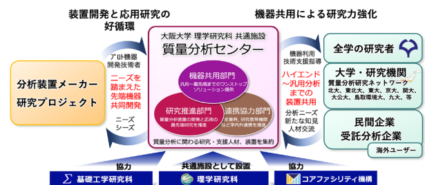
図2 質量分析センターの構成および役割

ロント研究センター先端質量分析学研究プロジェクトは、研究室で開発した装置を含め数々の質量分析装置を共用化しています。さらには、日本発の高分解能磁場型質量分析装置をはじめ、スパイラル軌道や多重周回型イオン光学系を有する高分解能飛行時間型質量分析装置を装置メーカーと協働して開発、実用化してきた実績を有しています 7) 。これらの装置・人材・研究基盤を有機的に結びつけることで、研究支援にとどまらず、研究課題創出や装置開発までを包含する新しい形の「共用・共創」の場を構築できるのではないか、という発想が生まれました。そこで、2025年4月、理学研究科、基礎工学研究科、コアファシリティ機構の三部局が連携し、共用質量分析装置、支援スタッフ、ならびに質量分析の応用研究・装置開発を専門とする研究者グループを集約した質量分析センターを、理学研究科の共通施設として設置しました。本センターは、機器共用部門、研究推進部門、連携協力部門の三部門から構成されています(図2)。