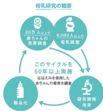
図1. 当社の乳児用ミルクにおける研究開発サイクル

当社の乳児用ミルクは母乳の機能を参考として、図1に示す研究開発のサイクルを通じて様々な改良を加えている。乳児用ミルクの改良につながる最初のステップが、母乳中成分の濃度分布や、子の発達・発育における各成分の役割を評価することである。ここでは、近年注目される母乳中有効成分について、その含量や子の発達・発育との関わりを評価した当社の取り組みを紹介する(2, 3)。